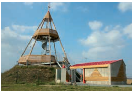
Rozhledna v Ocmanicích