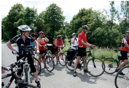
Cyklisté na trase