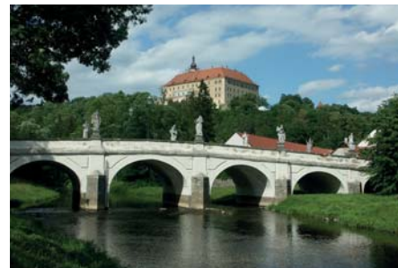
Zámek v Náměšti nad Oslavou